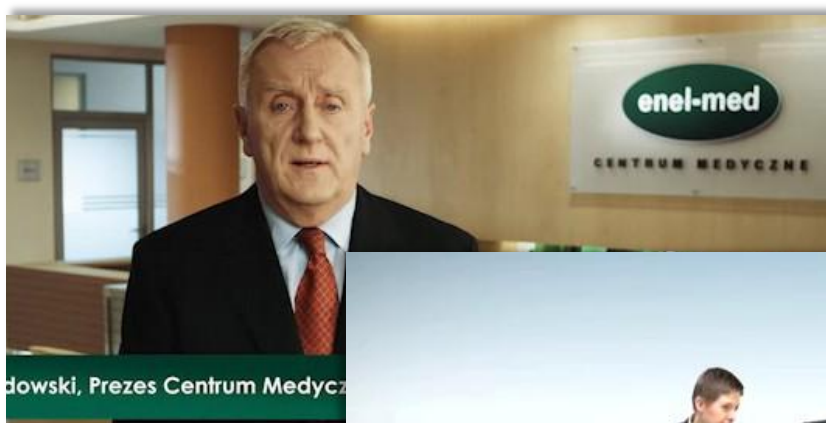
dowski, Prezes Centrum Medyczn